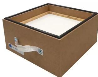
Filtre Hepa H14, 610 x 610 x 292 mm Référence : 50202146629