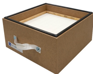
Filtre Hepa H14, 610 x 610 x 292 mm Référence : 50202146629