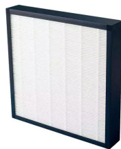
Préfiltre (M5) Référence : 978004