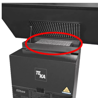
Kit de protection pour support de travail Référence : 978018