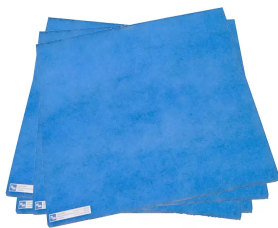
Filtre pour poussières grosses pour filtoo et Référence : 978003