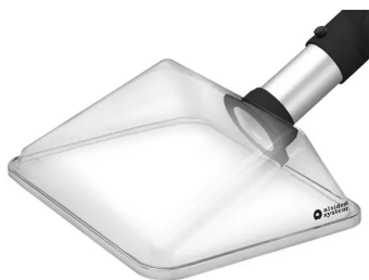
ALSIDENT hotte d'aspiration rectangulaire, DN 50 Référence : 1502422050001