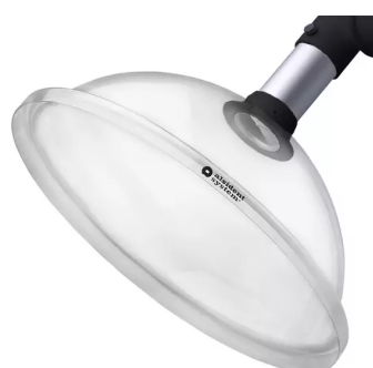
Hotte d'aspiration ronde, diam. 50 noir Référence : 15035050