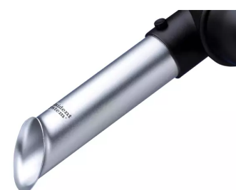
Buse d'aspiration, diam. 50 Référence : 15021001