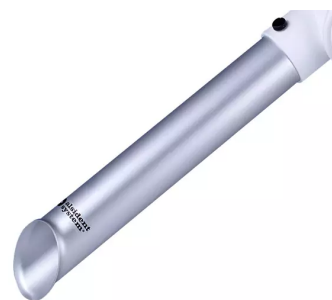
ALSIDENT Buse tubulaire DN 50, Référence : 15031