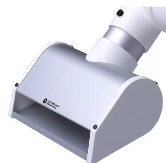
ALSIDENT buse à fente DN 50, Référence : 150105