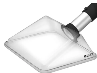
Hotte d'aspiration anguleuse diam. 50 noir Référence : 1502422050