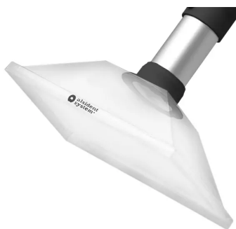
Hotte d'aspiration anguleuse, noir, diam. 50 Référence : 1502015050