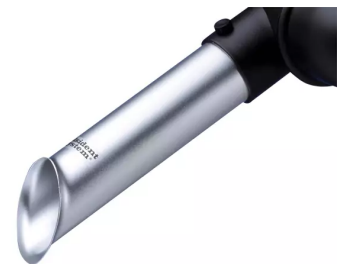
Buse d'aspiration, diam. 50 Référence : 15021001