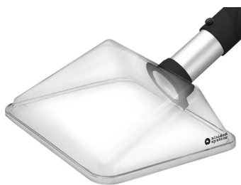
ALSIDENT hotte d'aspiration rectangulaire, DN 50