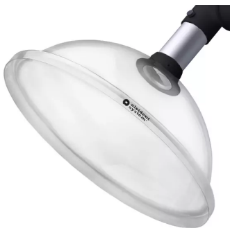
Hotte d'aspiration ronde, diam. 50 noir Référence : 15035050