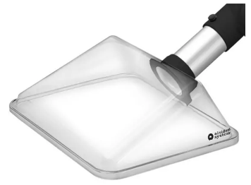
Hotte d'aspiration anguleuse diam. 50 noir Référence : 1502422050