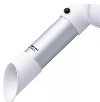
Buse d'aspiration diam. 50, tête en polypropylène Référence : 150225