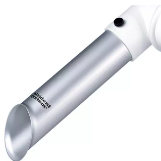
ALSIDENT Buse d'aspiration DN 50 Référence : 15021