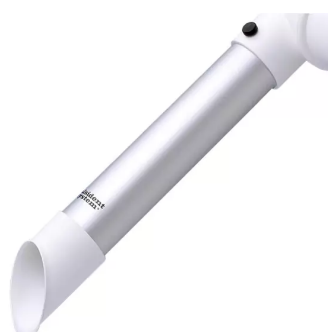
Buse d'aspiration diam. 50, tête en polypropylène Référence : 150325