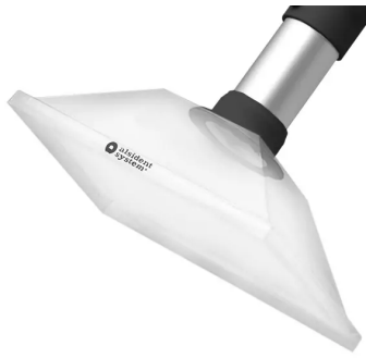
Hotte d'aspiration anguleuse, noir, diam. 50 Référence : 1502015050