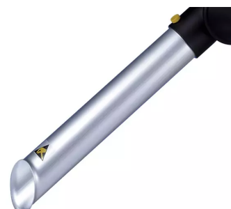
ALSIDENT Buse d'aspiration DN 50 (AS) Référence : 150316