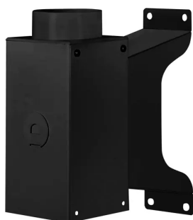
ALSIDENT Support mural, DN 75-50, noir Référence : 2195050