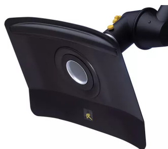
Hotte d'aspiration plate, diam. 50 antistatique Référence : 15033246