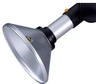
Hotte d'aspiration ronde, diam. 50, antistatique Référence : 150246