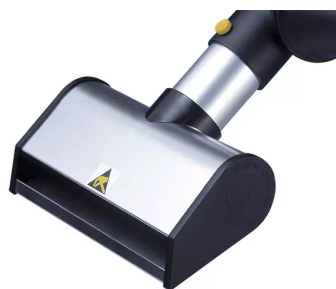
Buse à fente, diam. 50, antistatique Référence : 150206