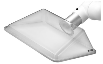
Hotte d'aspiration ALSIDENT angulaire, DN 75 Référence : 17542325