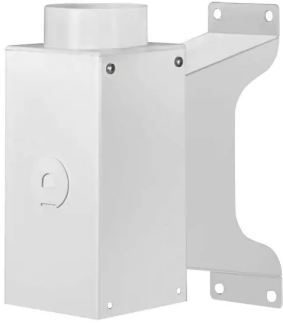
ALSIDENT fixation murale Diam. 75-50, blanche Référence : 2195