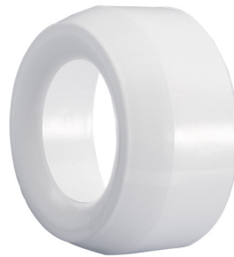
Réduction de 100 mm à 75 mm Référence : 410075