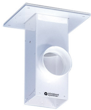
Colonne sur plafond pour montage de bras, blanc Référence : 225020