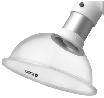
Hotte d'aspiration ALSIDENT, ronde diam. 75mm Référence : 175285