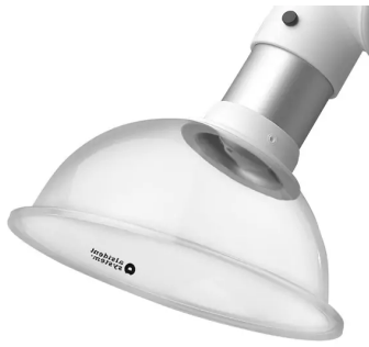
Hotte d'aspiration ALSIDENT, ronde diam. 75mm Référence : 175285