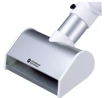
Buse à fente, diam. 75, blanc Référence : 175255