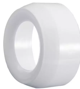
Réduction de 100 mm à 75 mm Référence : 410075