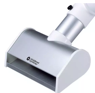
Buse à fente, diam. 75, blanc Référence : 175255