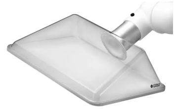
Hotte d'aspiration ALSIDENT angulaire, DN 75 Référence : 17542325