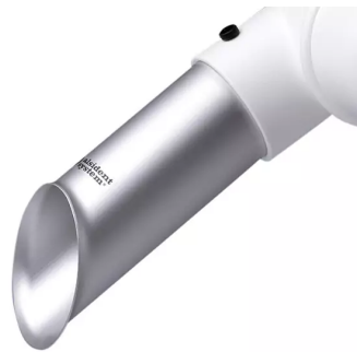
ALSIDENT Buse d'aspiration DN 75 Référence : 17525