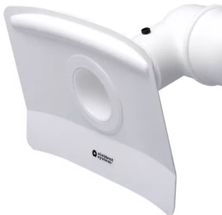
ALSIDENT Hotte d'aspiration plat, DN 100