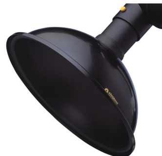
ALSIDENT hotte d'aspiration ronde, diam. 100 mm Référence : 1100506