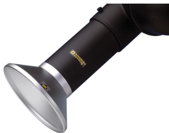
Hotte d'aspiration ronde, diam. 100 Référence : 1100246