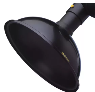
ALSIDENT hotte d'aspiration ronde, diam. 100 mm Référence : 1100506