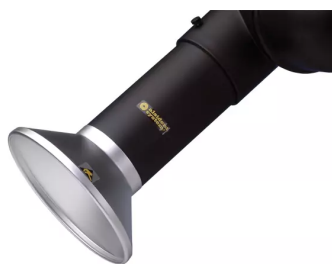
Hotte d'aspiration ronde, diam. 100 Référence : 1100246