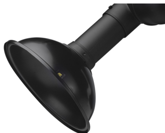
ALSIDENT Hotte d'aspiration, ronde, diam. 100 mm Référence : 1100356