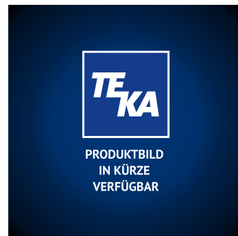
Kit d'extension filtre HEPA Référence de l'article : 4000950144002