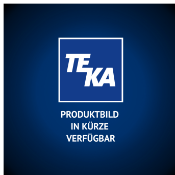
Pièce de transition pour FilterCube 4 Référence de l'article : 9501441940111