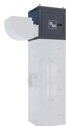
Option boîtier insonorisant pour ventilateur Référence de l'article : 950144194712