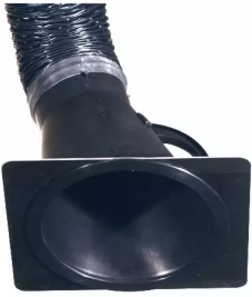
plaque de buse pour hotte d'aspiration, diam. 150 Référence : 66210