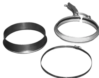
Matériel de raccordement, diam. 160 mm Référence : 96301