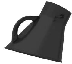
Hotte d'aspiration diam 150 pour bras d'aspiration Référence : 662000003