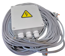
Couplage Master-Slave Référence : 150010032