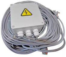
Couplage Master-Slave Référence : 150010032