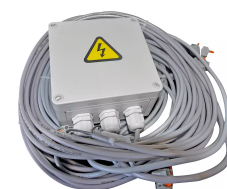
Couplage Master-Slave Référence : 150010016