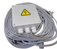
Couplage Master-Slave pour clapet/vanne d'arrêt Référence : 15001001604