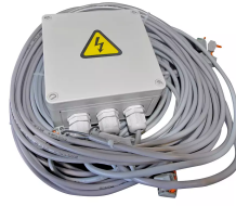
Couplage Master-Slave Référence : 15001001602