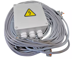
Couplage Master-Slave pour clapet/vanne d'arrêt Référence : 15001001604