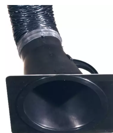
plaque de buse pour hotte d'aspiration, diam. 150 Référence : 66210