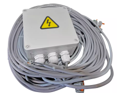
Couplage Master-Slave Référence : 150010016