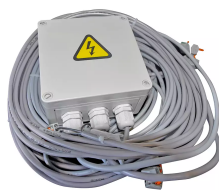
Couplage Master-Slave Référence : 15001001602