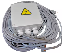
Couplage Master-Slave Référence : 15001001602