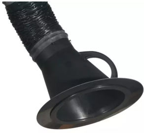
Adaptateur pour hotte d'aspiration diam. 150 Référence : 66220