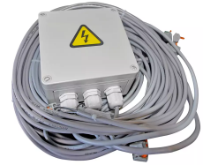
Couplage Master-Slave pour clapet/vanne d'arrêt Référence : 15001001604