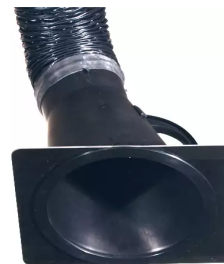
plaque de buse pour hotte d'aspiration, diam. 150 Référence : 66210