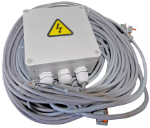
Couplage Master-Slave Référence : 150010032