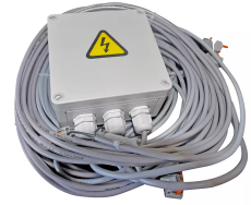
Couplage Master-Slave Référence : 150010016