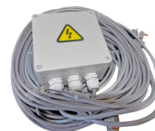
Couplage Master-Slave pour clapet/vanne d'arrêt Référence : 15001001604