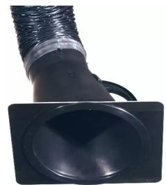
plaque de buse pour hotte d'aspiration, diam. 150 Référence : 66210