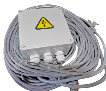
Couplage Master-Slave Référence : 15001001602