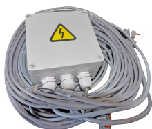
Couplage Master-Slave Référence : 150010032