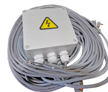
Couplage Master-Slave Référence : 150010016