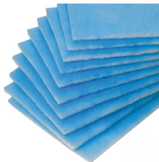
Jeu de 10 pré-filtres Référence : 10032