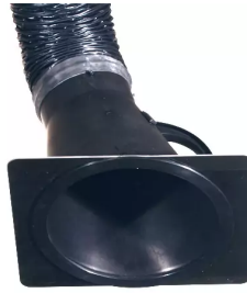
plaque de buse pour hotte d'aspiration, diam. 150 Référence : 66210