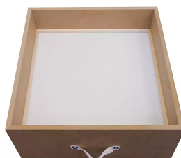
Cassette de filtration HEPA H13 Référence : 10030