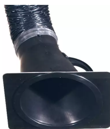
plaque de buse pour hotte d'aspiration, diam. 150 Référence : 66210