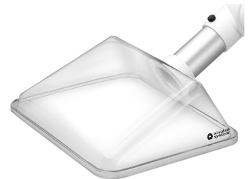
ALSIDENT Hotte d'aspiration angulaire, DN 50 Référence : 15024225