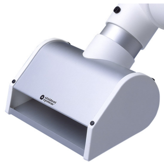
ALSIDENT buse à fente DN 50, Référence : 150105