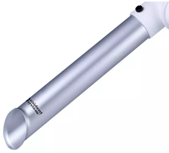
ALSIDENT Buse tubulaire DN 50, Référence : 15031