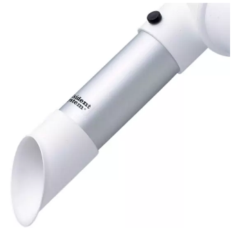
Buse d'aspiration diam. 50, tête en polypropylène Référence : 150225