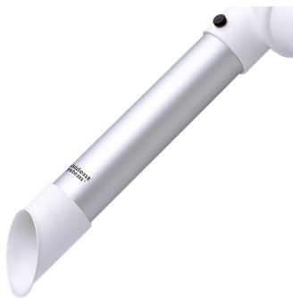
Buse d'aspiration diam. 50, tête en polypropylène Référence : 150325