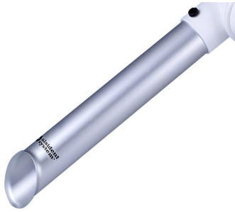
ALSIDENT Buse tubulaire DN 50, Référence : 15031