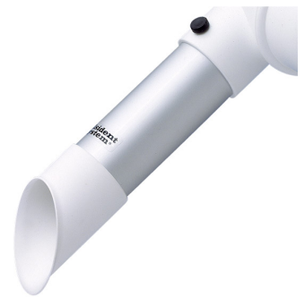
Buse d'aspiration diam. 50, tête en polypropylène Référence : 150225