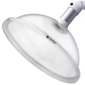
Hotte d'aspiration ronde, diam. 50, blanc Référence : 150355