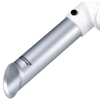
ALSIDENT Buse d'aspiration DN 50 Référence : 15021