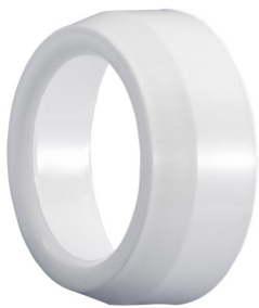
ALSIDENT Réduction 63 - 50 mm, blanche Référence : 46350