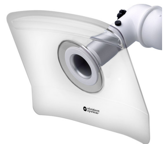
Hotte d'aspiration plate, diam. 50 blanc Référence : 15033245