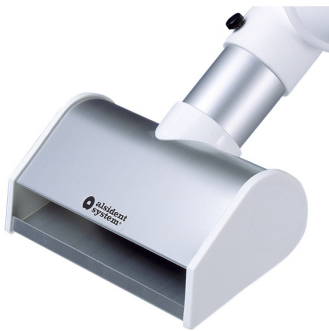
ALSIDENT Buse à fente DN 50 Référence : 150205