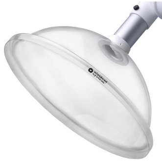
Hotte d'aspiration ronde, diam. 50, blanc Référence : 150355