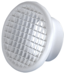
Grille de protection diam 50 blanc Référence : 516