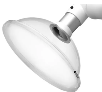
ALSIDENT Hotte d'aspiration ronde, DN 100 Référence : 1100505