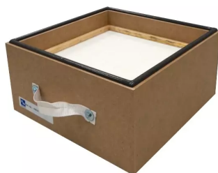
Filtro de partículas H14, 610x610x292+6 Minip.100 Pa Producto No.: 50202146629