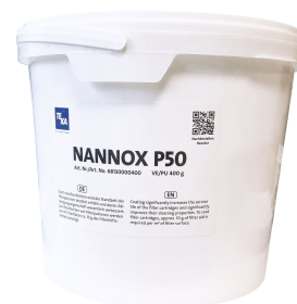
Auxiliar de filtración NANNOX P50 Producto No.: 68130000400