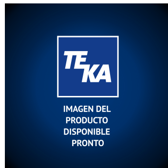
Pieza de transición para FilterCube 4 (SDK) a Producto No.: 9501441940111