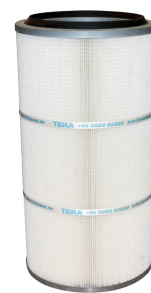
Cartucho de filtración, tipo easy clean nano Producto No.: 6160600312606