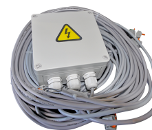
Master Slave enchufe de conexión para el control Producto No.: 15001001604