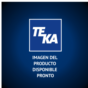
Pieza de transición 300 x 300 a DN 355 mm para el Producto No.: 7045060001