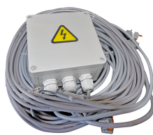
Circuito Master-Slave CEE 16A, 400V Producto No.: 150010016