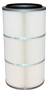
Cartucho de filtración, tipo easy clean + Producto No.: 6160600207706