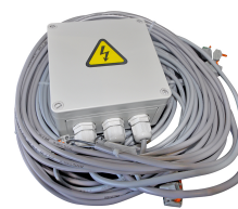
Control Master-Slave CEE 32A, 400V Producto No.: 150010032