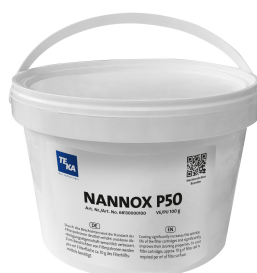
Auxiliar de filtración NANNOX P50 Producto No.: 68130000100