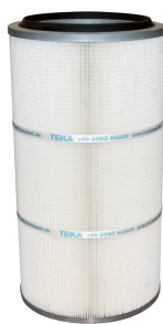
Cartucho de filtración, tipo easy clean nano Producto No.: 6160600307706