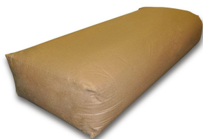
Auxiliar de filtración NANNOX P50 Producto No.: 68130010000