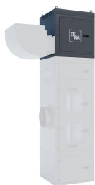
Opción carcasa insonorizada para FilterCube 4, Producto No.: 950144194712