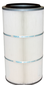
Cartucho de filtración, tipo easy clean + Producto No.: 6160600212508