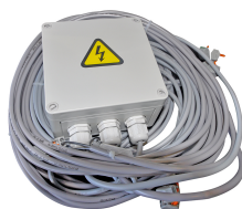
Control Master-Slave Enchufe-Schuko 16A, 230V para Producto No.: 15001001602