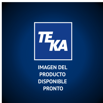
Carbón activo a granel de 7,5 kg para LFE Producto No.: 100197310