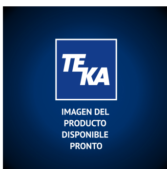
Esterilla de filtro de repuesto para Rittal Producto No.: 5020007079