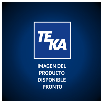
Filtro plegado G3, med. 62 x 62 x 48 mm Producto No.: 100350008