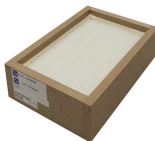
Filtro hepa H13, med. 337 x 230 x 100 mm