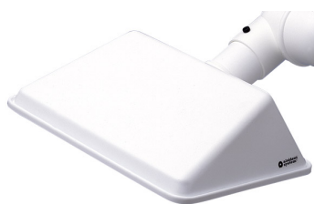
Campana de PVC, blanca diám. 75 mm Producto No.: 175423275