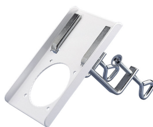
ALSIDENT soporte para mesa DN 75, blanco Producto No.: 27510