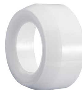
Manguito reductor ALSIDENT 100 mm - 75 mm, blanco Producto No.: 410075