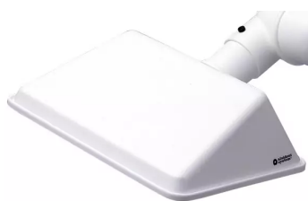
Campana de PVC, blanca diám. 75 mm Producto No.: 175423275