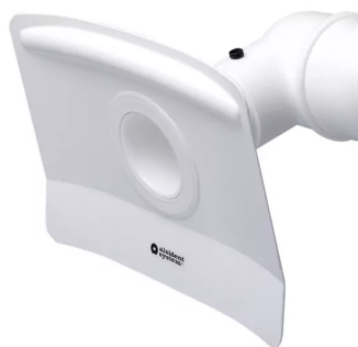
Bonete de aspiración plano ALSIDENT, NW 100, 420 x 280 mm Producto No.: 1100422875