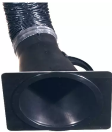
Placa-tobera para campana de aspiración 150 mm