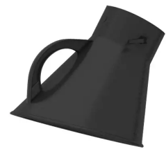
Campana para brazo de aspiración diám. 150