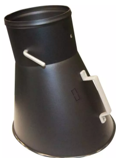
Campana metálica de aspiración, diám. 150 mm