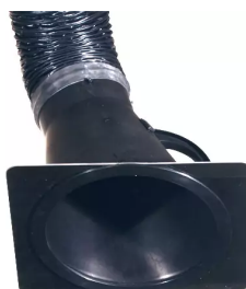
Placa-tobera para campana de aspiración 150 mm