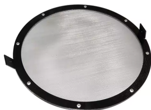
Rejilla de protección (malla fina) para montar