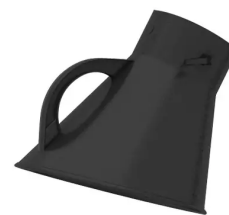
Campana para brazo de aspiración diám. 150 Producto No.: 662000003