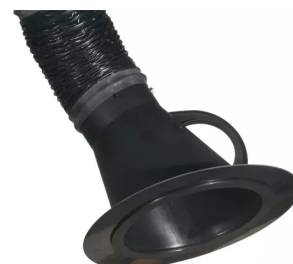
Placa tobera para campana de aspiración diám.150mm