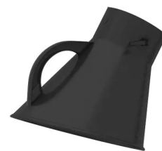
Campana para brazo de aspiración diám. 150