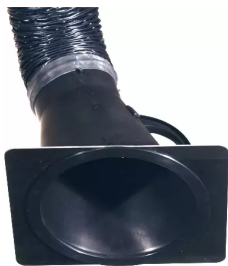
Placa-tobera para campana de aspiración 150 mm