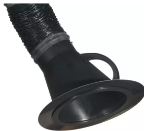
Placa tobera para campana de aspiración diám.150mm