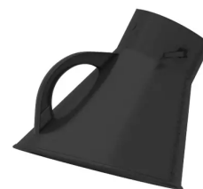
Campana para brazo de aspiración diám. 150 Producto No.: 662000003