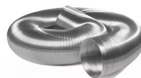
Tubería de salida DN 160