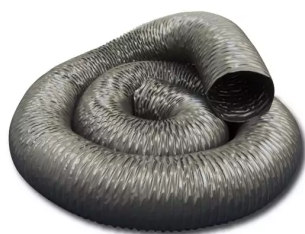
Manguera de repuesto para brazo flexible