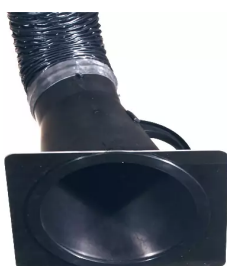
Placa-tobera para campana de aspiración 150 mm