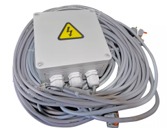
Circuito Master-Slave CEE 16A, 400V