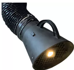
Juego de iluminación para 2 brazos junto con