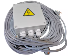
Master Slave enchufe de conexión para el control Producto No.: 15001001604