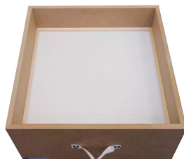
Filtro de partículas H13 superficie: 19,8 m² Producto No.: 10030