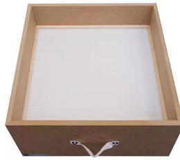
Filtro de partículas H13 superficie: 19,8 m 2 Producto No.: 10030