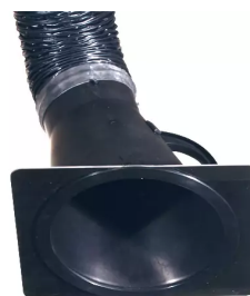
Placa-tobera para campana de aspiración 150 mm