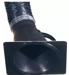
Placa-tobera para campana de aspiración 150 mm