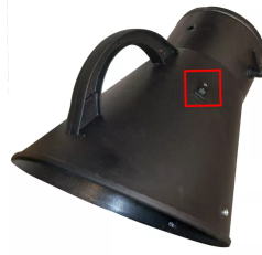
Interruptor de marcha/paro a través de la campana