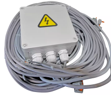
Control Master-Slave Enchufe-Schuko 16A, 230V para Producto No.: 15001001602