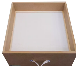
Filtro de partículas H13 superficie: 19,8 m 2 Producto No.: 10030