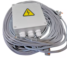
Control Master-Slave Enchufe-Schuko 16A, 230V para Producto No.: 15001001602