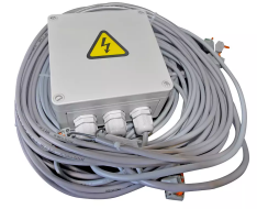
Master Slave enchufe de conexión para el control Producto No.: 15001001604