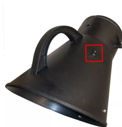
Interruptor de marcha/paro a través de la campana