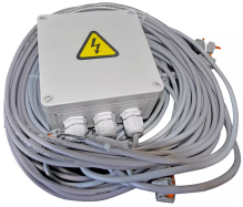
Control Master-Slave CEE 32A, 400V Producto No.: 150010032