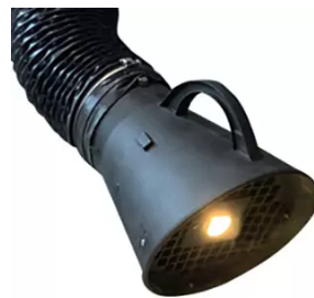
Juego de iluminación para 1 brazo de aspiración