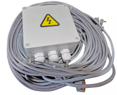
Circuito Master-Slave CEE 16A, 400V Producto No.: 150010016