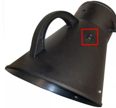
Interruptor de marcha/paro a través de la campana Producto No.: 96313321