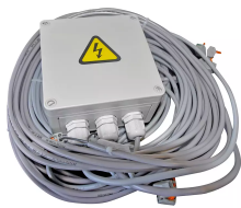
Control Master-Slave CEE 32A, 400V Producto No.: 150010032