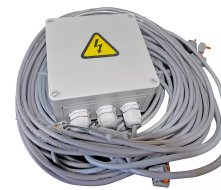
Master Slave enchufe de conexión para el control Producto No.: 15001001604