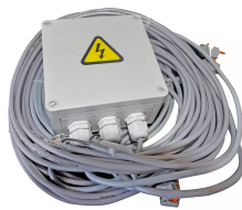
Control Master-Slave Enchufe-Schuko 16A, 230V para Producto No.: 15001001602