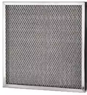
Prefiltro de malla de aluminio, 1 ud. Producto No.: 100008