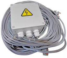
Control Master-Slave CEE 32A, 400V Producto No.: 150010032