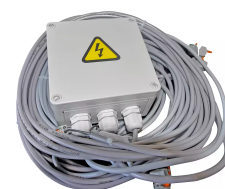
Circuito Master-Slave CEE 16A, 400V