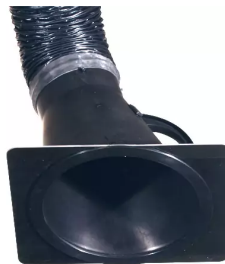
Placa-tobera para campana de aspiración 150 mm