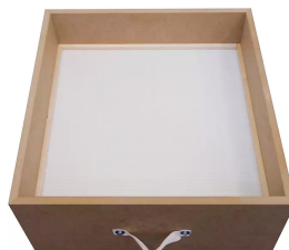
Filtro de partículas H13 superficie: 19,8 m 2 Producto No.: 10030