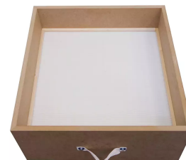
Casete de filtración H13, superficie de filtración Producto No.: 100357