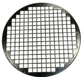
Rejilla de protección diám. 160 Producto No.: 41501