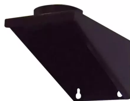
Soporte de pared para aspirador de 0,55 - 1,5 kW Producto No.: 96010