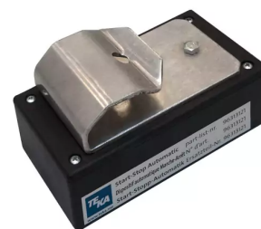
Arranque-parada automático con sensor de campo Producto No.: 963131220224