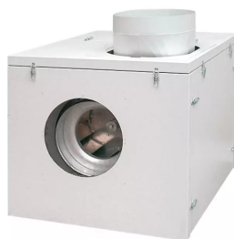
Carcasa insonora para 0,55 - 1,5 kW aspirador, Producto No.: 960101