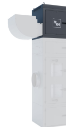
Opción carcasa insonorizada para FilterCube 4, Producto No.: 950144194712