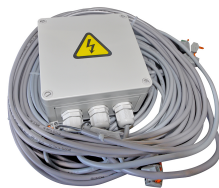
Master Slave enchufe de conexión para el control Producto No.: 15001001604