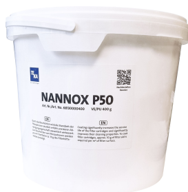
Auxiliar de filtración NANNOX P50 Producto No.: 68130000400