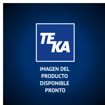
Módulo de ampliación para FC4 Producto No.: 4000950144002