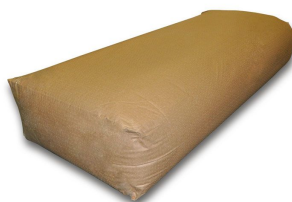
Auxiliar de filtración NANNOX P50 Producto No.: 68130010000