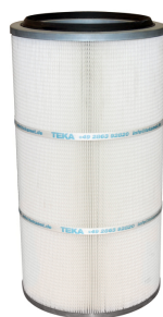
Cartucho de filtración, tipo easy clean nano Producto No.: 6160600312606