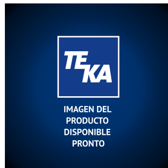
Convertidor de frecuenc. con transmisor de presión Producto No.: 962002009040