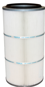
Cartucho de filtración, tipo easy clean + Producto No.: 6160600212508