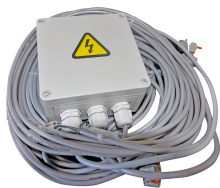
Control Master-Slave Enchufe-Schuko 16A, 230V para Producto No.: 15001001602