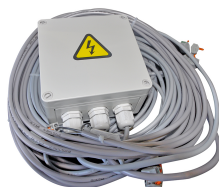
Control Master-Slave CEE 32A, 400V Producto No.: 150010032