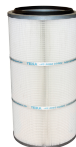
Cartucho de filtración, tipo easy clean + Producto No.: 6160600207706