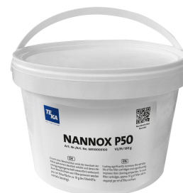
Auxiliar de filtración NANNOX P50 Producto No.: 68130000100