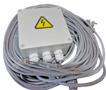
Circuito Master-Slave CEE 16A, 400V Producto No.: 150010016