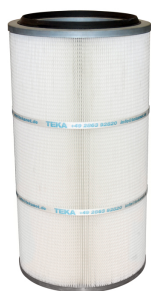
Cartucho de filtración, tipo easy clean nano Producto No.: 6160600307706