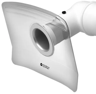
ALSIDENT Campana de aspiración , DN 100