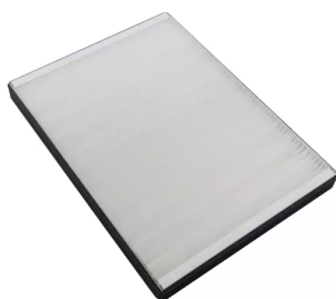
Filtro principal 283x206x25mm para FilterCase