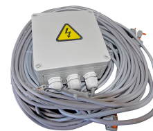
Control Master-Slave CEE 32A, 400V Producto No.: 150010032