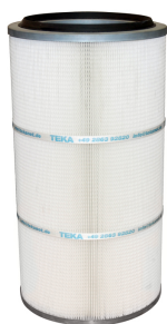
Cartucho de filtración, tipo easy clean + Producto No.: 6160600207706