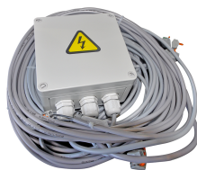
Circuito Master-Slave CEE 16A, 400V Producto No.: 150010016