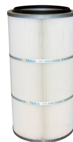
Cartucho de filtración, tipo easy clean nano Producto No.: 6160600312606