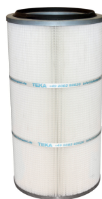
Cartucho de filtración, tipo easy clean nano Producto No.: 6160600307706