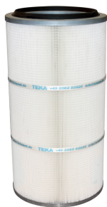
Cartucho de filtración, tipo easy clean + Producto No.: 6160600212508