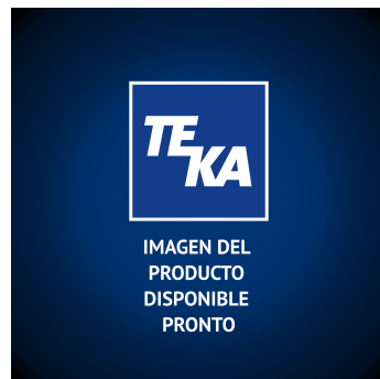
Pieza de transición para FilterCube 4 (SDK) a Producto No.: 9501441940111