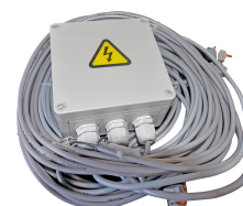
Master Slave enchufe de conexión para el control Producto No.: 15001001604