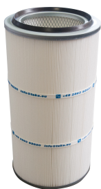
Cartucho de filtración, superficie 10 m 2 Producto No.: 6160600110008