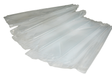
Bolsas de PE para el colector ( 10 pzs.) Producto No.: 10030251