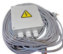
Control Master-Slave Enchufe-Schuko 16A, 230V para Producto No.: 15001001602