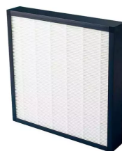
Prefiltro para filtoo y ViroLine y AirToo Producto No.: 978004