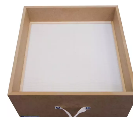
Filtro principal para filtoo y AirToo Producto No.: 978005