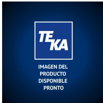
Filtro plegado G3, med. 62 x 62 x 48 mm Producto No.: 100350008