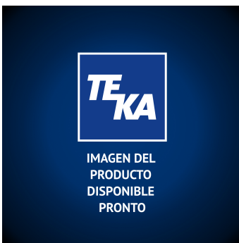
Filtro de carbón activo 337 x 230 x 212 mm Producto No.: 97059