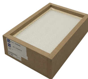
Filtro hepa H13, med. 337 x 230 x 100 mm Producto No.: 100350004