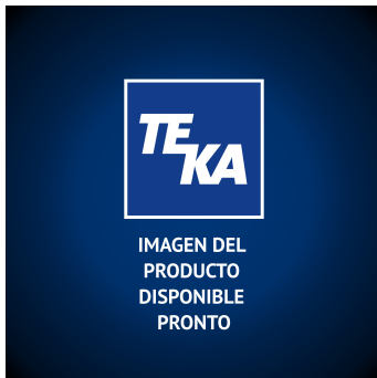
Carbón activo a granel de 7,5 kg para LFE Producto No.: 100197310