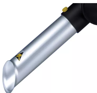
Boquilla de tubo ALSIDENT NW 50 (AS), antiestática