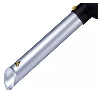
Boquilla de tubo ALSIDENT NW 50 (AS), antiestática,