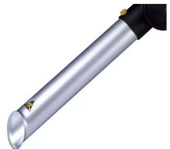
Boquilla de tubo ALSIDENT NW 50 (AS), antiestática, Producto No.: 150316