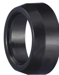
Boca de aspiración redonda ALSIDENT, NW 50(AS), antiestática Producto No.: 150246