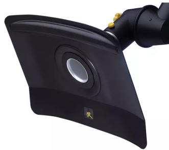
Campana de aspiración ALSIDENT plana, DN 50 (AS) Producto No.: 15033246