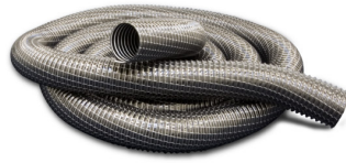
Manguera de alto vacío diám. 100 mm, long: 2,5 m Producto No.: 511040025