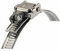
Abrazadera DN 100 mm Producto No.: 51184