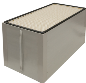
Filtro acumulador 610x305x292 mm Producto No.: 1003502