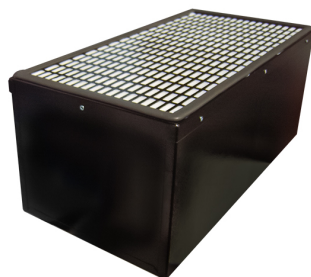
Casete de carbón activo 610x305x292 mm Producto No.: 9705202