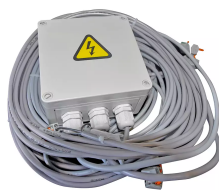
Control Master-Slave Enchufe-Schuko 16A, 230V para Producto No.: 15001001602