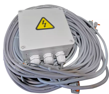
Control Master-Slave CEE 32A, 400V Producto No.: 150010032