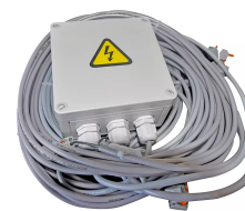
Master Slave enchufe de conexión para el control Producto No.: 15001001604