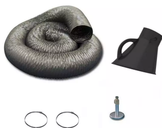
Manguera de aspiración para aspirador móvil DN 150 Producto No.: 96316