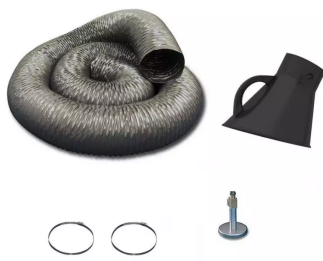
Manguera de aspiración para aspirador móvil DN 150 Producto No.: 96316