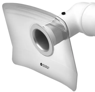
ALSIDENT Campana de aspiración , DN 100