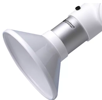
Campana de aspiración para brazo sistema 100