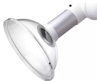
Campana de aspiración para brazo sistema 100