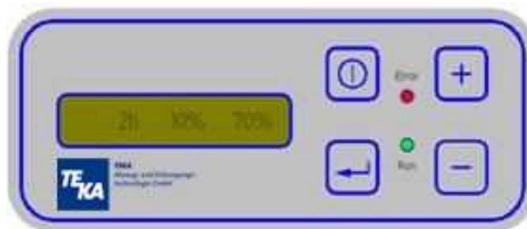
Abbildung: Folienbedienfeld mit Klartextanzeige

Die Bedienung des HANDYCART erfolgt an dem Folienbedienfeld mit Klartextanzeige. Hier werden alle Funktionen des HANDYCART eingestellt.